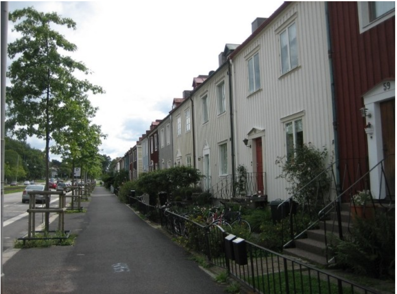
Urbant integrerade radhus i Kungsladugård