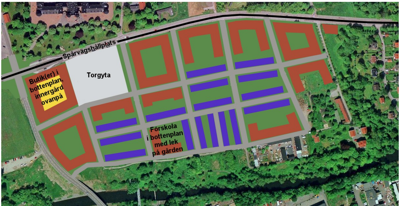
Översiktlig idéskiss - brunt anger flerbostadsbebyggelse, blått anger radhus.